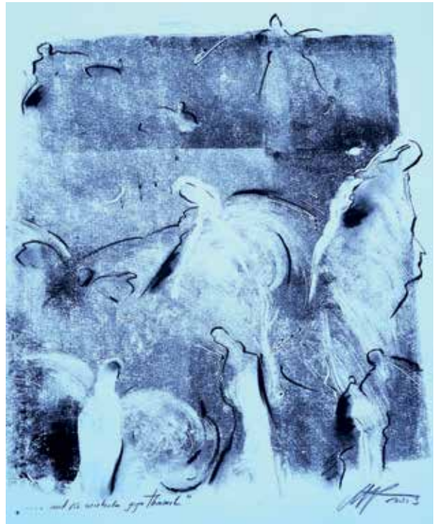
„...und sie wirbeln gegen Himmel“ Monotypie, 50 x 40 cm, © Margit Resch

Nur menschliche Architektur. Einzelwohnungen prinzipiell in der Erde; obenauf Wiese und Wald; notwendige Hochhäuser von Grün überwuchert; alle nötigen Verkehrswege von wi-