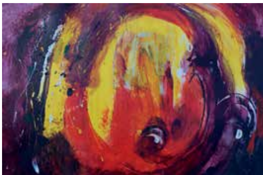
Kosmisches Licht – Acryl, 50x70 cm, © Margit Resch

Jeder Tag wurde mit einem Tanz begonnen und beendet. Stanko hat unsere Arbeit immer wieder sehr schön mit passenden Bibelstellen verbunden und theoretisch beleuchtet. Es hat uns fasziniert, wie gut alle die Bibel kannten. Die meisten hatten zuvor eine kirchliche Missionschule besucht und es zeigte sich, dass die christliche Ausbildung in Afrika auf einem hohen Niveau abläuft. Die gestaltpädagogische Art des Bibellebens bzw. Stankos Gesichtspunkte der Interpretation mancher Bibelstellen haben die Studierenden sehr angesprochen.