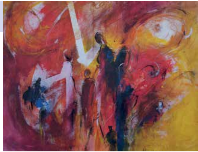
„Insieme“ – Acryl, 40x50 cm

(Dr. Alexander Van der Bellen – Aus der Rede vor der Bundesversammlung anlässlich seiner Angelobung am 26. Jänner 2017 - http://www.bundespraesident.at/fileadmin/user_upload/Interview-pdfs/Angelobungsrede_Homepage.pdf )