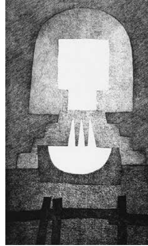
Holzschnitt Brunnenvision von Alois Spichtig

Auf einem Platz sieht er eine Menge Leute fleißig arbeiten und wundert sich, dass sie so viel Arbeit haben und doch so arm waren. Er sieht einen Tabernakel und eine offene Tür, und er denkt sich: Du musst in den Tabernakel treten und schauen, was darin ist, und musst bald zur Tür kommen. Er kommt in eine Küche, die einer ganzen Gemeinde gehört. Zur rechten Hand sieht er eine Stiege, auf der einige Leute hinaufsteigen. Er sieht einen Brunnen, aus dem mit lautem Getöse Wein, Öl und Honig fließen. Er denkt: Du musst die Stiege hinaufgehen und schauen, woher der Brunnen kommt. Und er verwundert sich sehr, dass sie so arm waren und doch niemand hineinging, aus dem Brunnen zu schöpfen, was sie sehr wohl hätten tun können, da er doch allen gemeinsam gehörte. Und er denkt bei sich selber: Du sollst hinausgehen und schauen, was die Leute