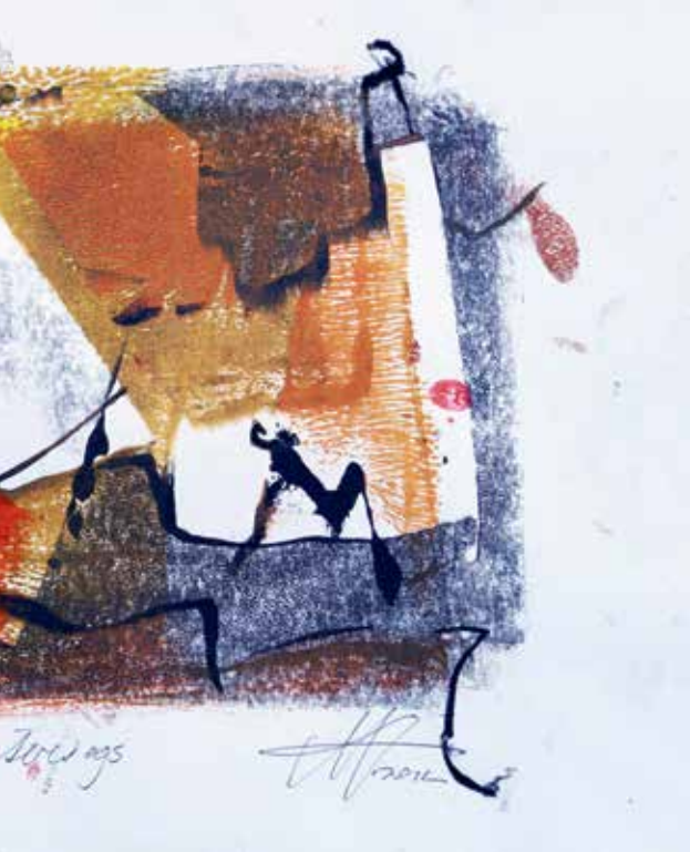
„Unterwegs“ – Monotypie, 30 x 25 cm, © Margit Resch

gere Zeit besuchen zu kommen. In der nächsten Therapiestunde, eine Woche später erzählt Herr Pfleger, dass ihn dieser Traum noch beschäftigt hätte. Ich schlug ihm vor, sich einen Aspekt im Traum auszusuchen, mit dem er sich identifizieren will, wie es James Simkin empfiehlt 4 : „Nach dem Denken der Gestalttherapie ist alles im Traum ein Aspekt der Persönlichkeit des Träumers und so schreibt man, wenn man träumt, sein eigenes Lebensskript ...“ (Simkin 1976: 89) 5 .