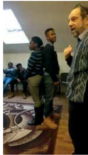
Bibliodrama: Adam und Eva nach afrikanischer Art

Wir schlossen das Programm mit einem überaus schön gestalteten Gottesdienst ab. Zu hören, wie alle sangen, und zu sehen, wie alle genussvoll tanzten, war ein traumhaftes Erlebnis. Bei der Schlussreflexion beantworteten die TeilnehmerInnen die Frage „Was nehme ich von dieser Woche mit ins Leben und was hat mich besonders